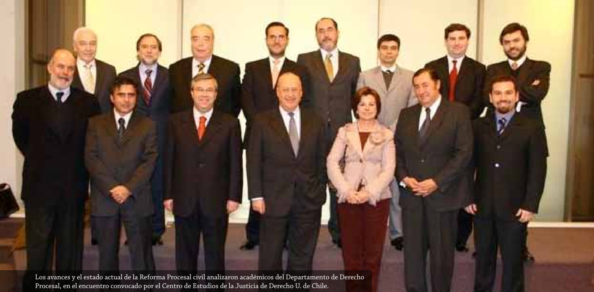
Los avances y el estado actual de la Reforma Procesal civil analizaron académicos del Departamento de Derecho Procesal, en el encuentro convocado por el Centro de Estudios de la Justicia de Derecho U. de Chile.