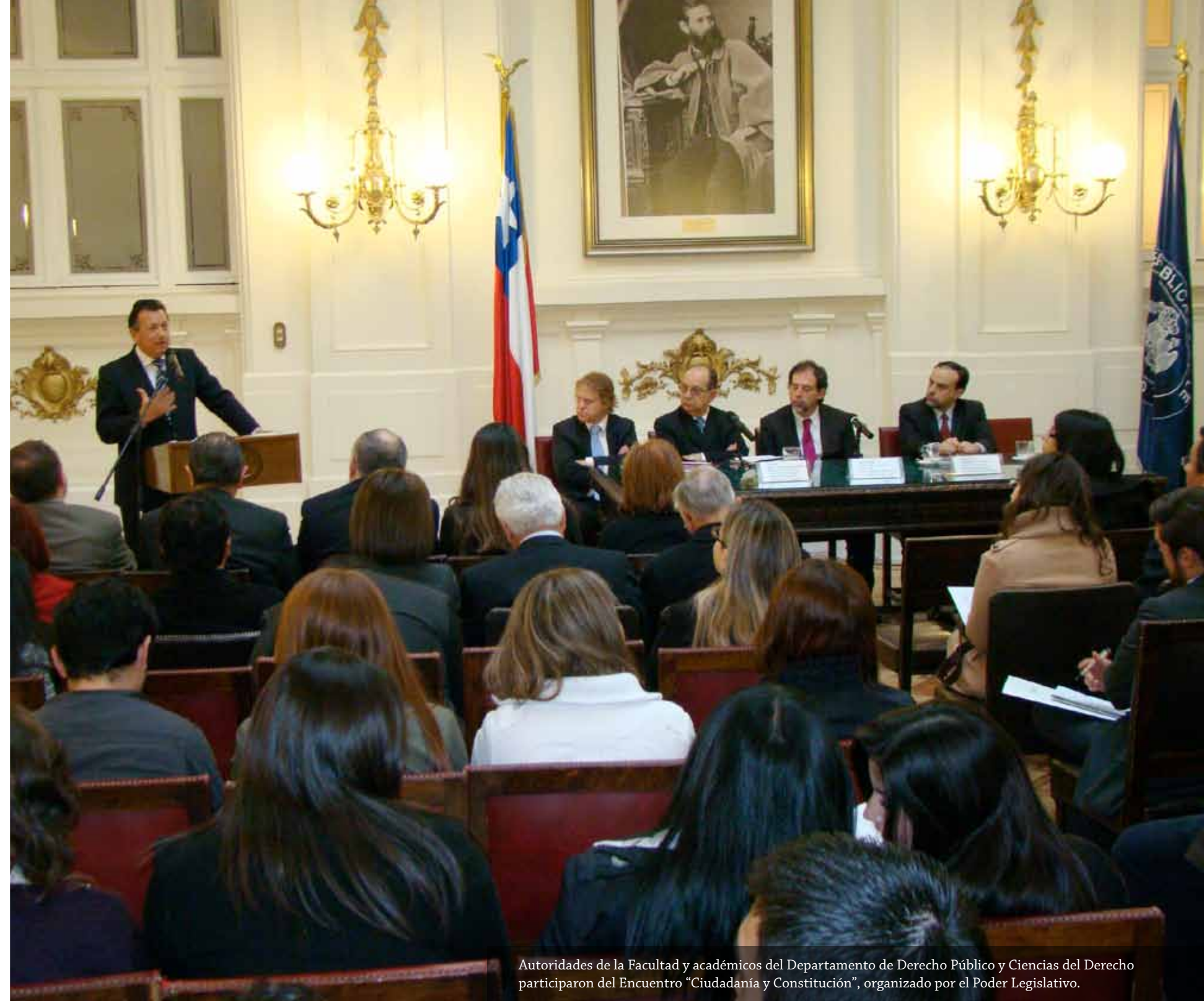
Autoridades de la Facultad y académicos del Departamento de Derecho Público y Ciencias del Derecho participaron del Encuentro "Ciudadanía y Constitución", organizado por el Poder Legislativo.