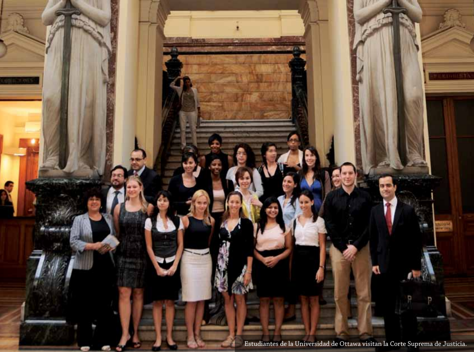
Estudiantes de la Universidad de Ottawa visitan la Corte Suprema de Justicia.