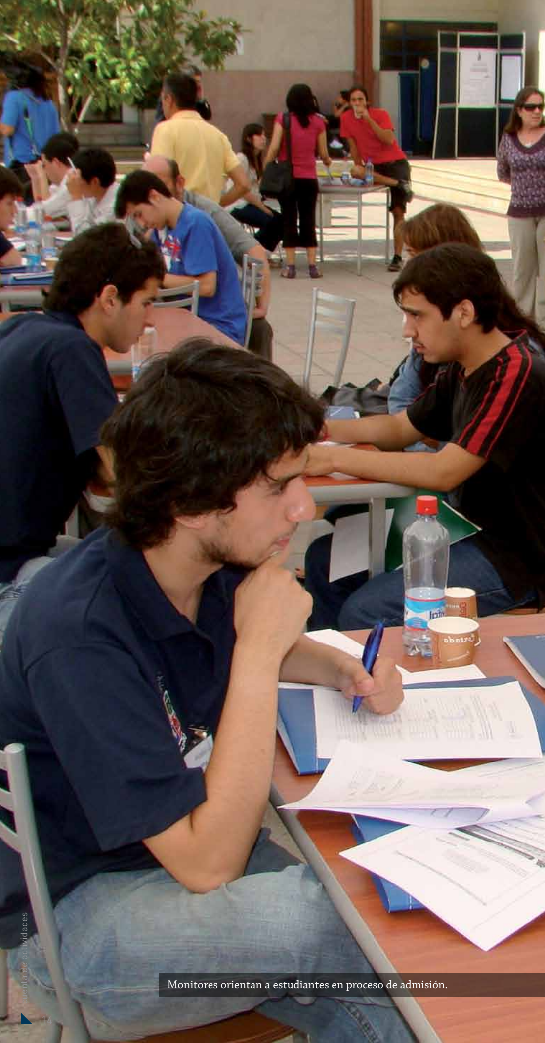
Monitores orientan a estudiantes en proceso de admisión.