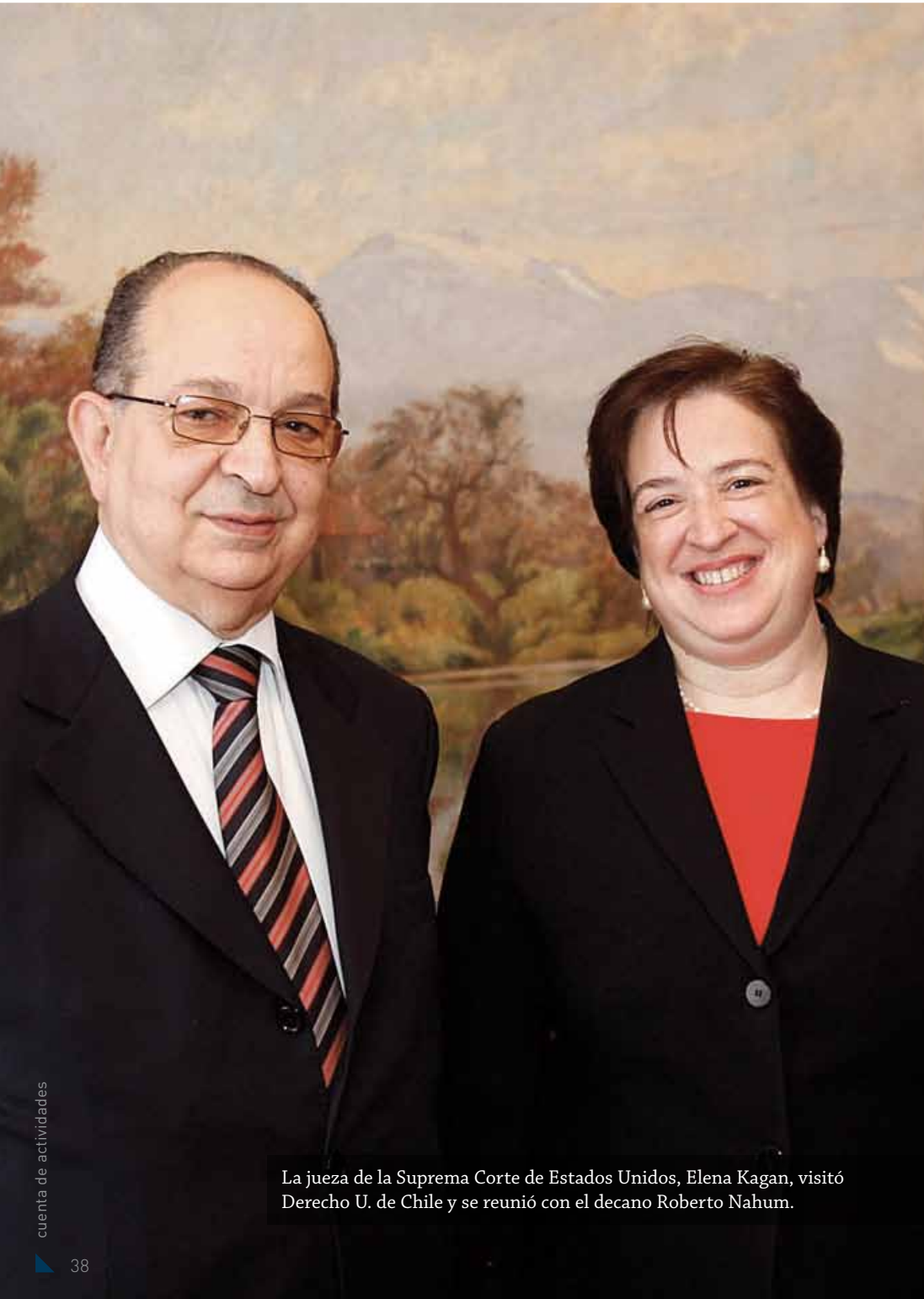
La jueza de la Suprema Corte de Estados Unidos, Elena Kagan, visitó Derecho U. de Chile y se reunió con el decano Roberto Nahum.