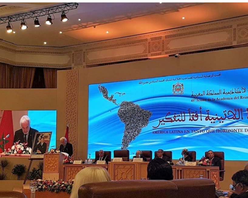
Testera palacio Academia del Reino. Eventos de 2018 y 2022.