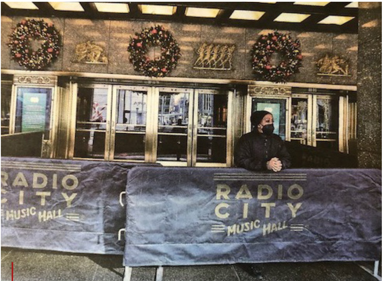
Rockefeller Center, NYC. Las Rockettes y su tradicional show navideño neoyorquino, suspendido indefinidamente. Símbolo del momento en EE.UU.

Biden es un político experimentado. Lo positivo es que, pese a la decepción del momento, la esperanza cívica estadounidense permanece. Ergo , ¡Bienvenido, año 2022!