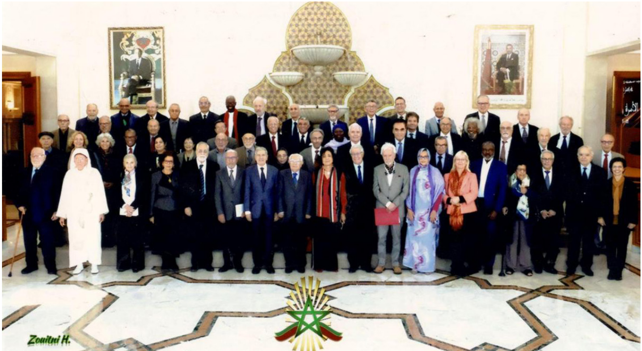
Miembros de la Academia del Reino de Marruecos.