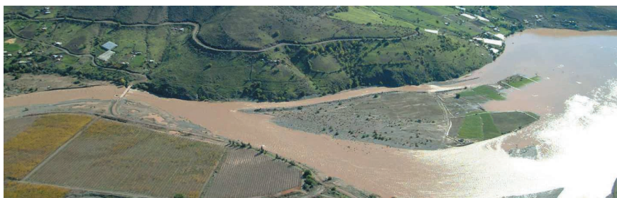
Desborde del río Tulahuén, sector el Tome, comuna de Monte Patria, 300 metros aguas debajo de la Quebrada de Cárcamo, y 2 km al sur de la entrada al embalse La Paloma. Fotografía tomada desde un helicóptero durante los temporales de julio de 1997.