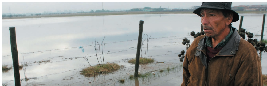
Inundaciones en el sector de Lampay Batuco, Región Metropolitana. 28 de junio de 2006.