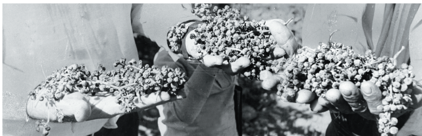
En la fotografía, Santa Cruz: otra muestra de la cruel sequía que ha azotado a esta zona. Agricultores exhiben muestras de uvas en la Viña Nerquihue, cuyos racimos y la fruta misma son de tamaños sumamente inferiores a otros años. Sequía de 1968-1969.