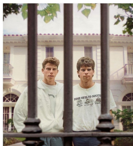
LOS HERMANOS MENENDEZ

La visión conjunta de ambos productos cinematográficos permite formarse una opinión personal acerca de este crimen de la vida real. En modo “revisiónismo histórico” muestran tanto la voluntad como la capacidad de cambiar las narrativas oficiales, para bien... o para mal