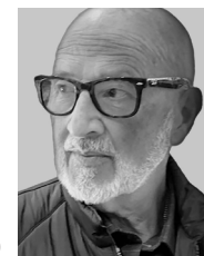
JUAN C. CAPPELLO

El domingo 21 de julio pasado, con su renuncia como candidato a la reelección, el Presidente Biden revolucionó el ambiente político de Estados Unidos. Posteriormente la Convención Nacional Demócrata designó a la actual Vicepresidenta, Kamala Harris, como la candidata presidencial, y ahora, iguala o supera a Donald J. Trump en las encuestas múltiples (48% contra 43%, USA Today/Suffolk U. ) y en comentarios de prensa y medios sociales.